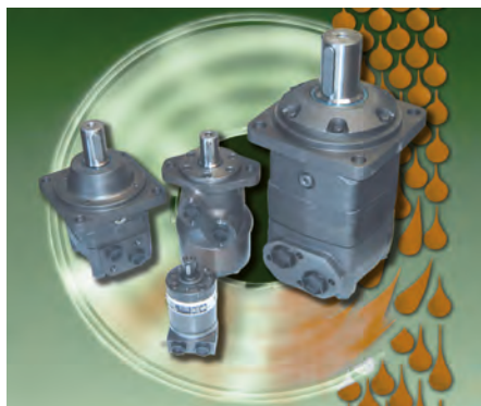
▲ Motori orbitali in 1500 modelli differenti.