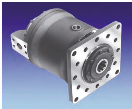
▲ Motori a pistoni assiali, cilindrata fissa, 10-2000 rpm, 400 BAR.