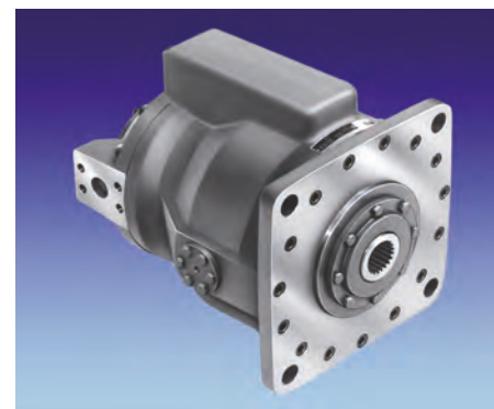
▲ Motori a pistoni assiali, cilindrata variabile, 10-2000 rpm, 400 BAR.