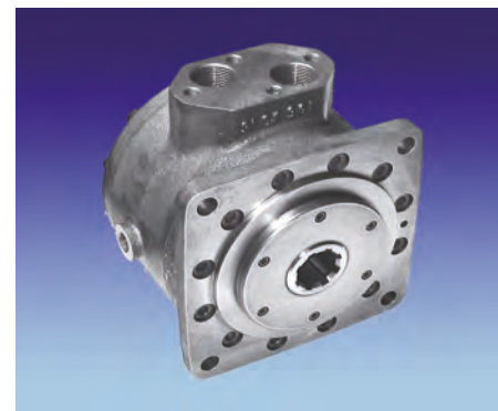
▲ Motori a pistoni assiali, cilindrata fissa, 10-300 rpm, 180 BAR.