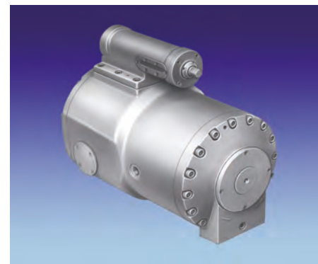
▲ Motori a pistoni assiali cilindr. variabile 1-1000 rpm 210 BAR.