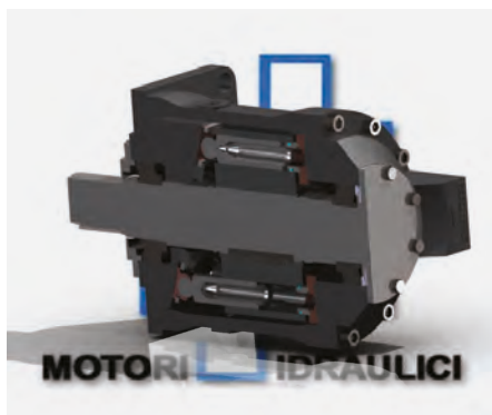
▲ Sezione motori HF.