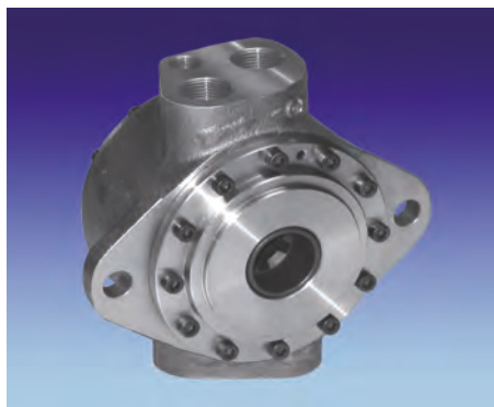
▲ Motori a pistoni assiali, cilindrata fissa, 10-500 rpm, 180 BAR.