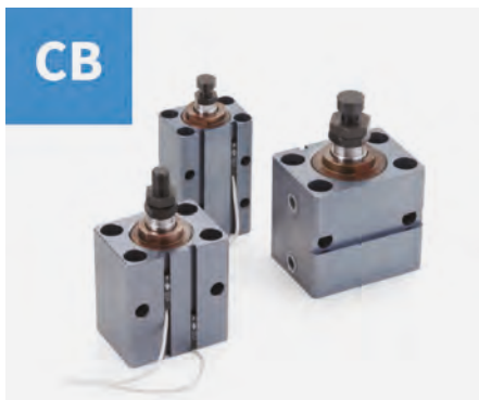
▲ Cilindri a corsa breve magnetici - Alesaggi da 25 a 100 mm.