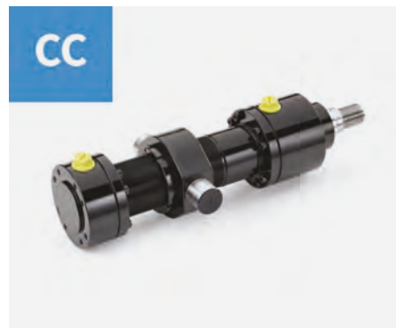
▲ Cilindri idraulici ISO6022, anche in versione con trasduttore (CCT).