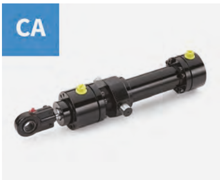
▲ Cilindri idraulici ISO6020/1, anche in versione con trasduttore (CAT).