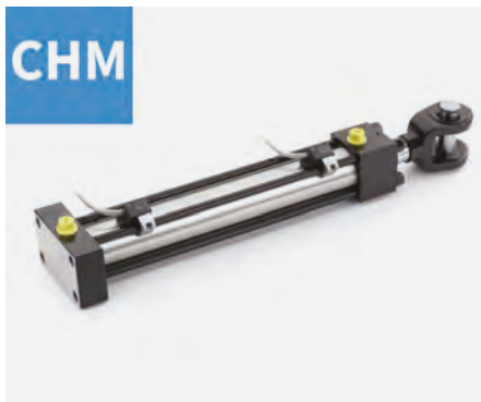
▲ Cilindri idraulici magnetici ISO6020/2, DIN24554.