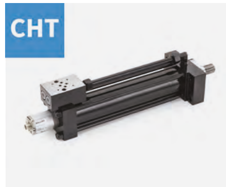
▲ Servocilindri con trasduttore ISO6020/2, DIN24554.