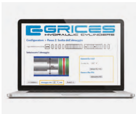
▲ Configuratore online per cilindri, disegni, offerte e ordini.