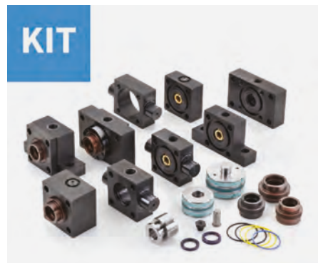
▲ Kit componenti e accessori.